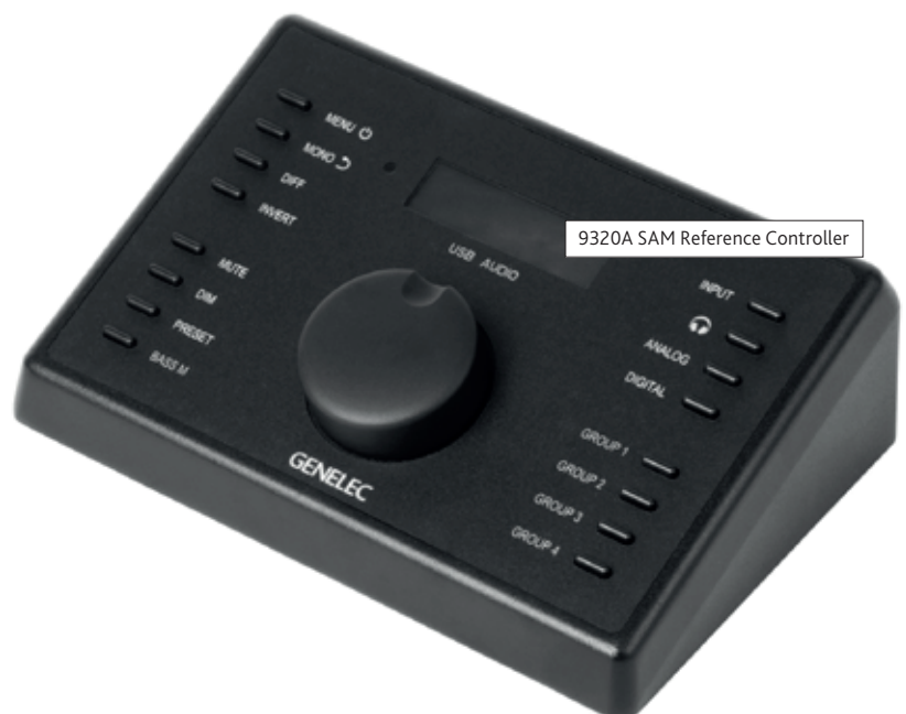
9320A SAM Reference Controller

De immersive audio-functionaliteit wordt ingezet voor bewegende geluidsbronnen door de ruimte. Maar ook voor verbeterde lokalisatie van geluidsbronnen (acteurs, muzikanten en playback muziek) in het gehele podiumbeeld, inclusief dieptewerking. Deze functionaliteit werkt middels aangepaste Wave Field Synthesis-algoritmen, waarbij integratie mogelijk is met DAW's, mengtafels of aansturing via OSC. Met technieken zoals tagging kan de lokalisatie van geluidsbronnen zelfs geautomatiseerd worden.