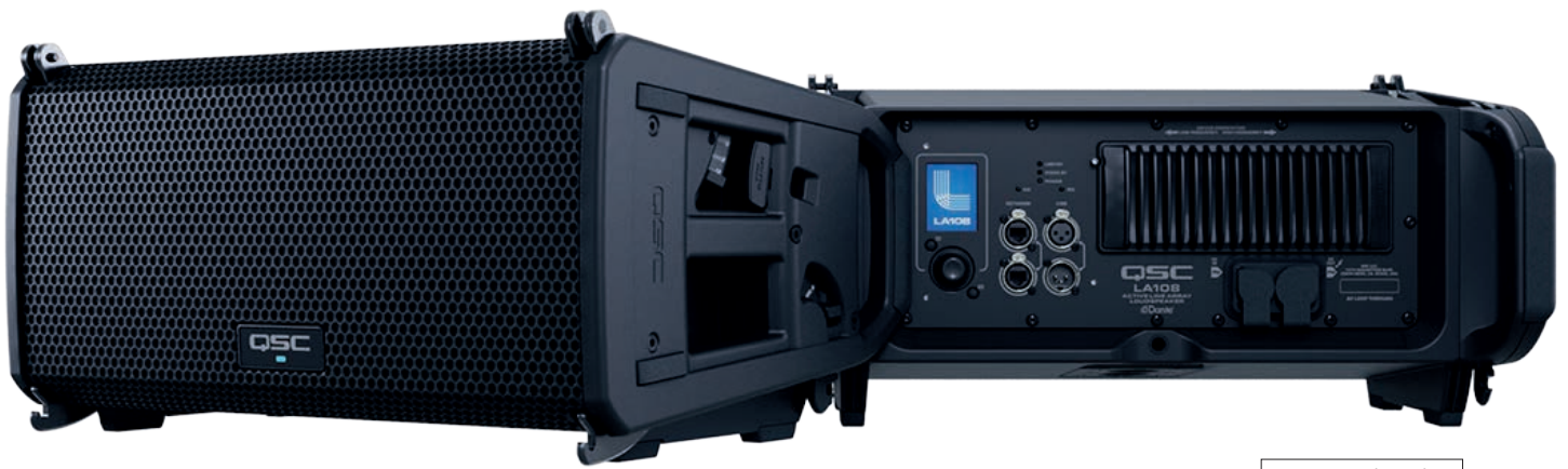
QSC Pro Audio L Class