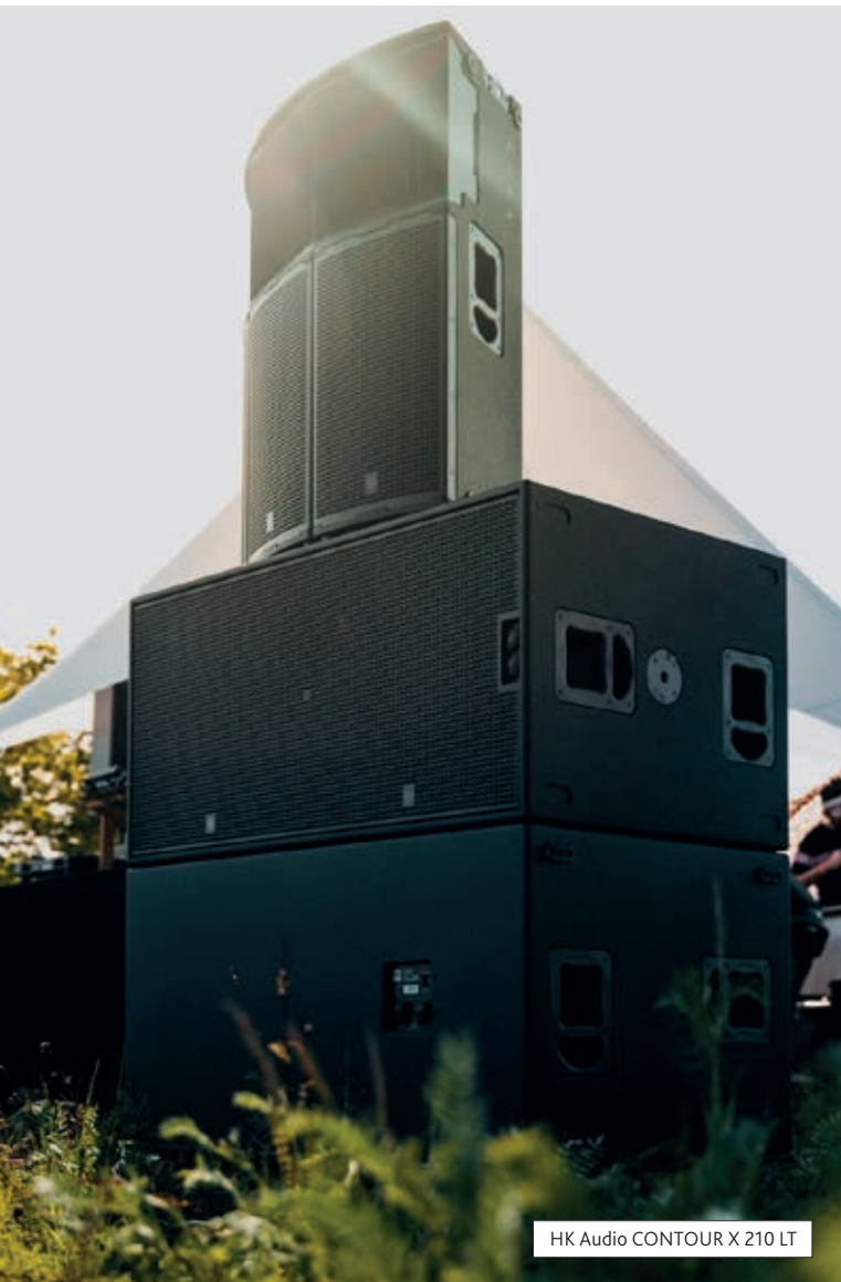
HK Audio CONTOUR X 210 LT

Het systeem is niet merkgebonden, biedt een regelbare actieve akoestiek met één druk op de knop en onderdrukt achtergrondruis (airco, verlichting etc.). Er is geen vorm van tijdsvariatie of digitaal gestuurde decorrelatiemethoden, maar wel uitsluitend natuurlijke galm door middel van recirculatie op basis van vectoren. Daarnaast is het systeem betaalbaar en schaalbaar en garandeert Amadeus Care uitstekende technische ondersteuning.