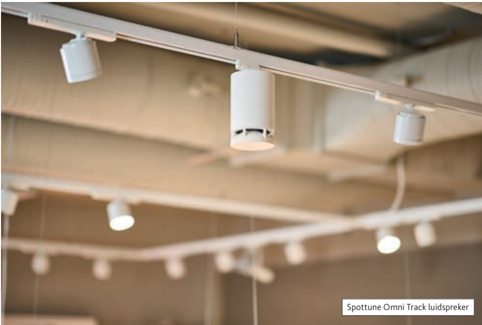
Spottune Omni Track luidspreker