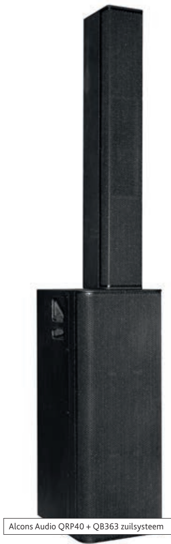
Alcons Audio QRP40 + QB363 zuilsysteem

getrouwe respons moet worden geprojecteerd met een zeer nauwkeurige dekking; het is ideaal in akoestisch uitdagende omgevingen of toepassingen waar muzikaliteit en verstaanbaarheid-over-afstand vereist zijn.