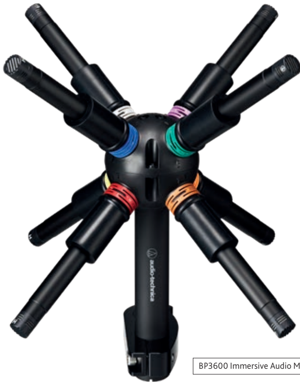
BP3600 Immersive Audio Microphone

kanaals array biedt voldoende ruimtelijkheid en gecontroleerde scheiding, iets wat andere alles-in-één-microfoons voor Immersive Audio niet hebben.